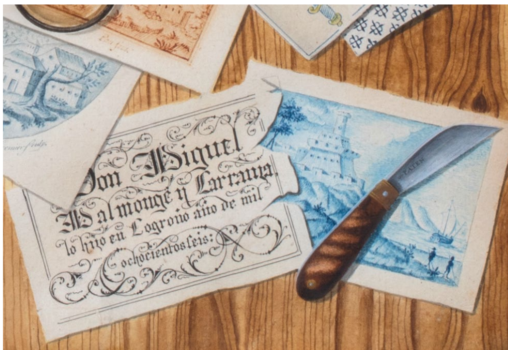
Fig. 2. Miguel Malmonge y Carranza, detalle de la cartela de la firma de Mesa revuelta con varios objetos y papeles presididos por un retrato de Carlos IV, rey de España, 1806. Colección particular.

El interés que supone que este trompe-l'oeil sea hasta ahora la única obra identificada de este autor, así como su calidad y riqueza iconográfica, justifican suficientemente esta investigación, en la que se rectifica el nombre de su autor, se recopilan los datos sobre él conocidos y se analiza su vida, en la que destaca su relación no continuada con Logroño, sino meramente coyuntural y circunscrita al año de 1806.