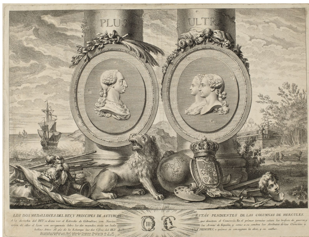
Fig. 6. Manuel Salvador Carmona, Carlos III y los príncipes de Asturias, 1766. Madrid, Museo Nacional del Prado, G002580.