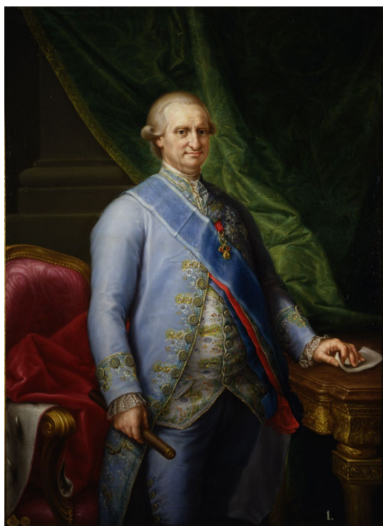
Fig. 4. Francisco Bayeu. Carlos IV, rey de España . 1790-1791. Madrid, cortesía de la RABASF.