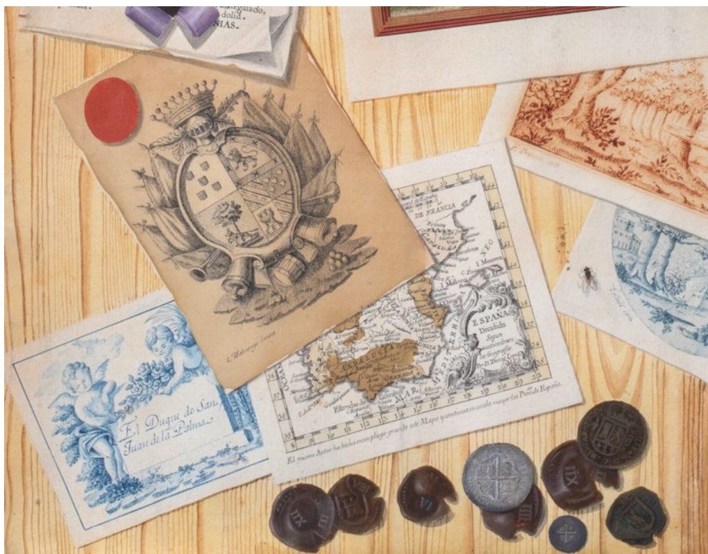
Fig. 7. Miguel Malmonge y Carranza, detalle del escudo firmado de Mesa revuelta con varios objetos y papeles presididos por un retrato de Carlos IV, rey de España, 1806. Colección particular.

Las armas del cuartel 1º se relacionan de modo muy general con las de Portugal, aunque les falta la bordura de gules con los siete castillos de oro, con cinco escusones cada uno puestos en cruz, y cada uno a su vez llevando cinco bezantes de plata (empleado así por el apellido Souza, Sousa o Sosa). Las del tercero, muy comunes a muchos apellidos, podrían ser Ayala. Las del cuartel 4º coinciden en gran medida con las de Guevara.