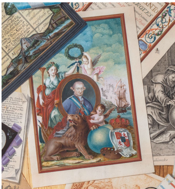
Fig. 3. Miguel Malmonge y Carranza, detalle de retrato de Carlos IV de Mesa revuelta con varios objetos y papeles presididos por un retrato de Carlos IV, rey de España , 1806. Colección particular.