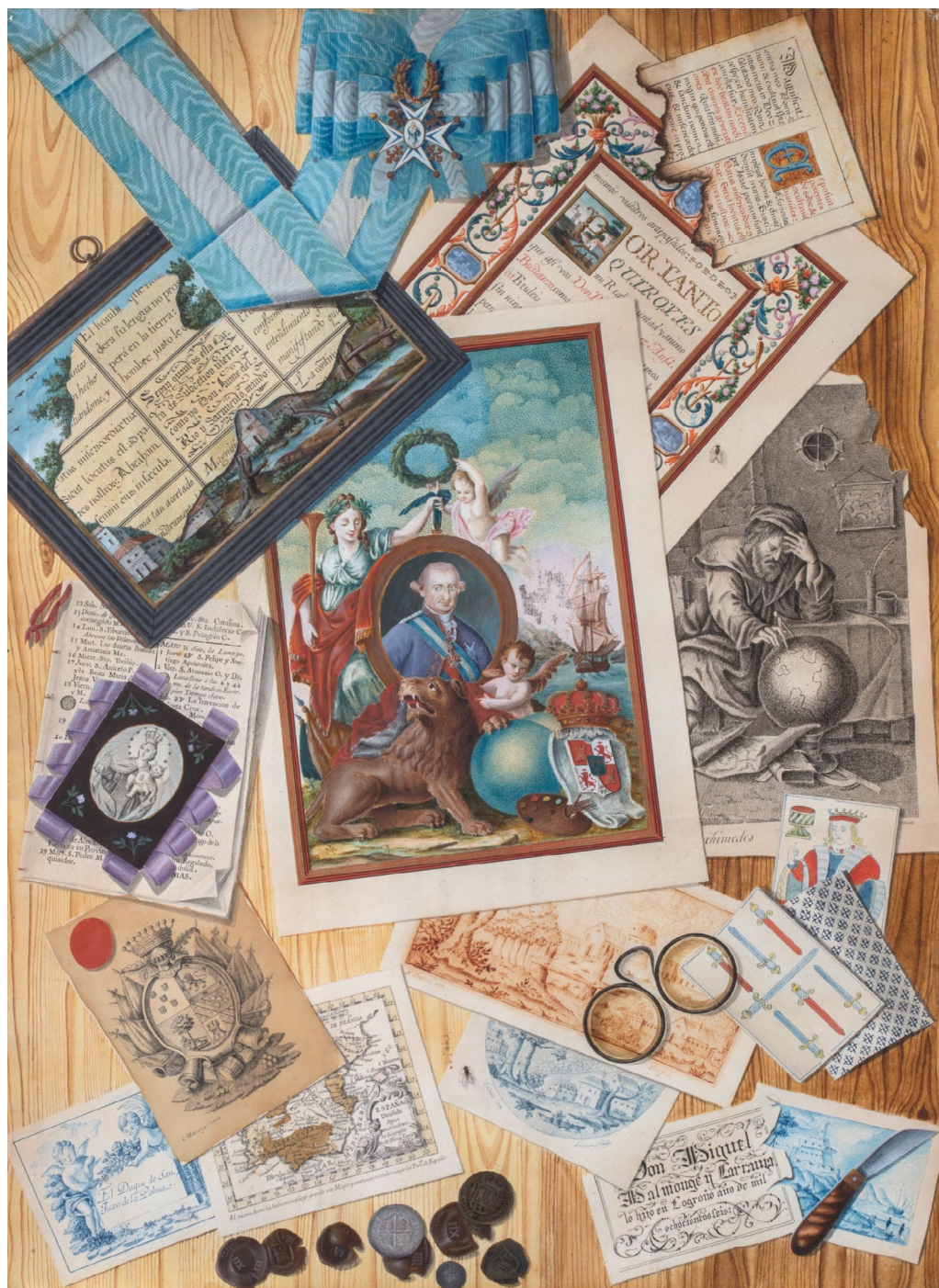
Fig. 1. Miguel Malmonge y Carranza, Mesa revuelta con varios objetos y papeles presididos por un retrato de Carlos IV, rey de España, 1806 . Colección particular.