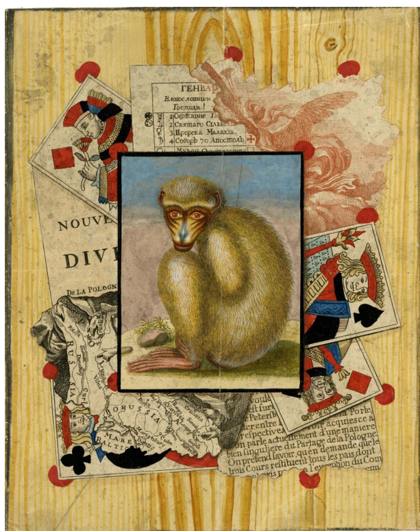
Fig. 8. Christian Gottlob Winterschmidt (1755-post. 1809), Popurri con naipes e impresos sobre una tabla fingida con una estampa de un simio en el centro . Londres, The British Museum © The Trustees of the British Museum.

neerlandesa del siglo XVII, ramilletes de flores, aves o animales dotados de un colorido vivaz e intenso como contrapunto de las tintas negras. Coetáneo de Malmonge, algunos de estos trabajos de Winterschmidt, conservados en el British Museum, en Londres 42 , se fechan entre 1770 y 1779, como el Popurri con cuatro naipes, impresos y grabados sobre una tabla fingida con una estampa de un simio en el centro 43 (fig. 8).