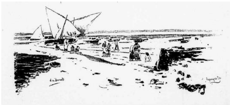
Imagen 3: BERUETE, Aureliano de (1885): [«Una playa»], El Día . Número extraordinario, 27-1, h. 2r. 1-4.