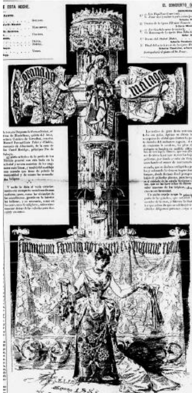
Imagen 1: MÉLIDA, Arturo (1885): [«La Caridad. Escudos de Granada y Málaga. Las armas de la casa de Cervellón»], El Día. Número extraordinario , 27-I, h. 1r. c. 2-3.